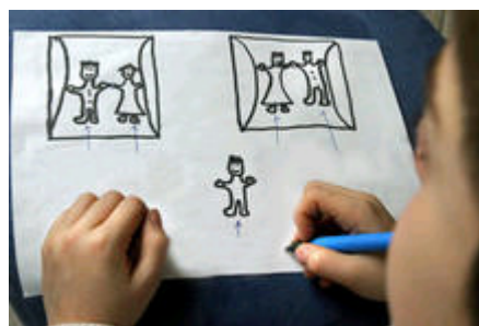
Familientherapeuten raten dazu, ältere Kinder bei der Regelung des Umgangs miteinzubeziehen